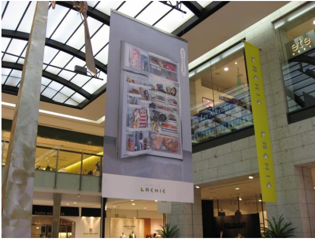
① 久屋中央バトンバナー(W2,000×H3,600)