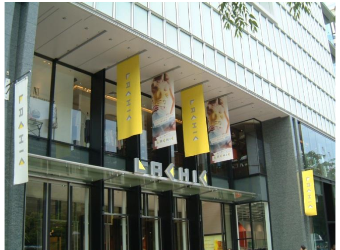
④ 久屋エントランスバナー(W1,200×H3,000)